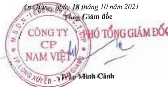
Phó Tổng Giám Đốc